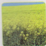
brukev řepka olejka