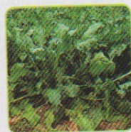
řepa obecná cukrovka